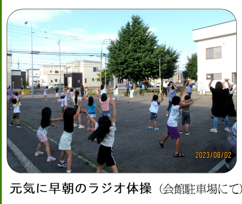
元気に早朝のラジオ体操(会館駐車場にて)

7月26日〜8月6日、今年度は花園公園改修工事のため会館横の駐車場、毎朝6時30分からラジオ体操を行いました。 連日の猛暑に負けず、朝から元気よく子どもたち20人、大人8人程が体を動かすことができました。 なお、例年より低学年の子が多く参加していました。あいにく最終日のみ小雨で体操は中止となりましたが、