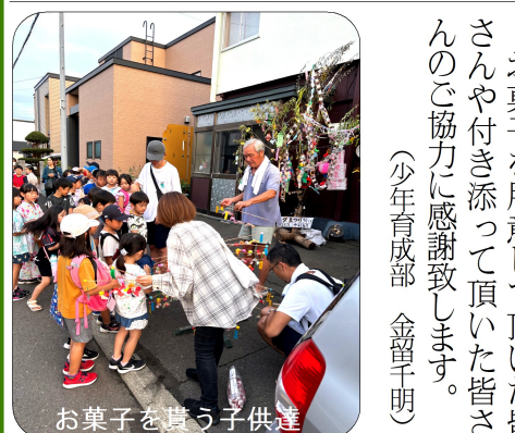
お菓子を貰う子供達

8月7日(月)、4町内会合同で七夕まつりが行われました。 ひよこ子ども会からは32人参加し、約130名から4つのグループに分かれ、家々を回って「ローソク出せ出せよ」と歌い、カバンいっぱいにお菓子を貰いました。 その後は屯田中央公園に集まり、花火を行って子ども達は笑顔いっぱい楽しんでいました。 お菓子を用意して頂いた皆さんや付き添って頂いた皆さんのご協力に感謝致します。(少年育成部 金留早明)