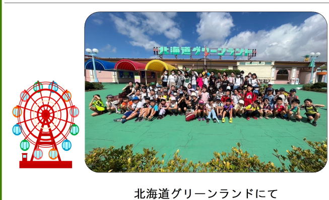
北海道グリーンランドにて

6月に雨で行けなかったグリーンランドへ、8月17日(木)に総勢100名程で行くことができました。 ひよこ子ども会からは、25名の参加がありました。強風のため、ジェットコースターや観覧車は乗れませんでした。が、天気には恵まれ、子ども達は走り回って遊具に乗っていました。 帰りのバスでも疲れて寝る子は少なく、お友達との会話を楽しみました。 朝早くからお弁当の用意をしてくださった家族の皆様、ありがとうございました。(少年育成部 原田亜希子)