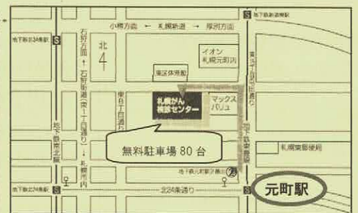
地下鉄東豊線「元町」2番出口から徒歩7分