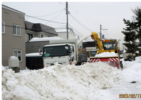
ロータリーで雪を積み込む！

今年度も活動自粛を余儀なくされた一年でした。来年度は5月からコロナが5類になるということで私たちを取り巻く環境も変わっていくと思いますが、これからは変わらず感染予防、抵抗力を上げるためにしっかり睡眠、無理のない運動を続けたいと思います。その中で女性部として出来ることを見つけられたらなど、思います。1月の女性部主催によるがん検診は7名の受診でした。これからの健康な毎日のために年2回のがん検診をご活用ください。