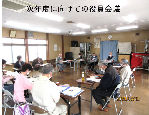
次年度に向けての役員会議